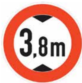
Abbildung 6: Tatsächliche Höhe (Zeichen 265)

Ragt die Ladung seitlich mehr als 40 cm über die Fahrzeugleuchten, bei Kraftfahrzeugen über den äußeren Rand der Lichtaustrittsflächen der Begrenzungs- oder Schlussleuchten hinaus, so ist sie, wenn nötig (StVO § 22 Abs. 5), kenntlich zu machen, und zwar seitlich höchstens 40 cm von ihrem Rand und höchstens 1,5 m über der Fahrbahn nach vorn durch eine Leuchte mit weißem, nach hinten durch eine mit rotem Licht.“