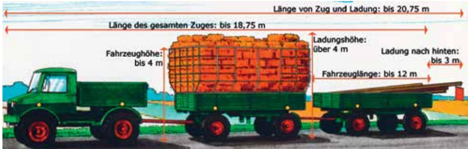
Abbildung 2: Fahrzeug- und Ladungsabmessungen mit Lof-Erzeugnissen