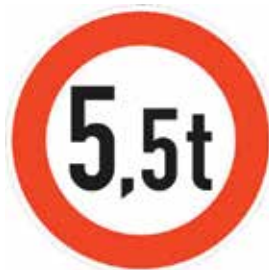
Abbildung 3: Tatsächliches Gewicht (bei Zügen: jedes einzelnen Fahrzeugs, Zeichen 262)

Beim Befahren von Alleen muss darauf geachtet werden, dass für Fahrzeug und Ladung ausreichend Platz vorhanden ist. Nicht immer