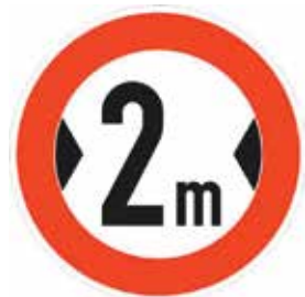
Abbildung 5: Tatsächliche Breite (Zeichen 264)