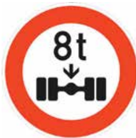
Abbildung 4: Tatsächliche Achslast (Zeichen 263)