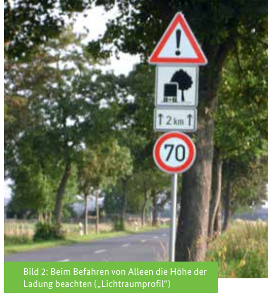
Bild 2: Beim Befahren von Alleen die Höhe der Ladung beachten („Lichtraumprofil“)

Diese Sicherungsmittel dürfen nicht höher als 1,5 m über der Fahrbahn angebracht werden. Wenn nötig (StVO § 17 Abs. 1), ist mindestens eine Leuchte mit rotem Licht an gleicher