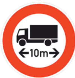
Abbildung 7: Tatsächliche Länge (Zeichen 266)