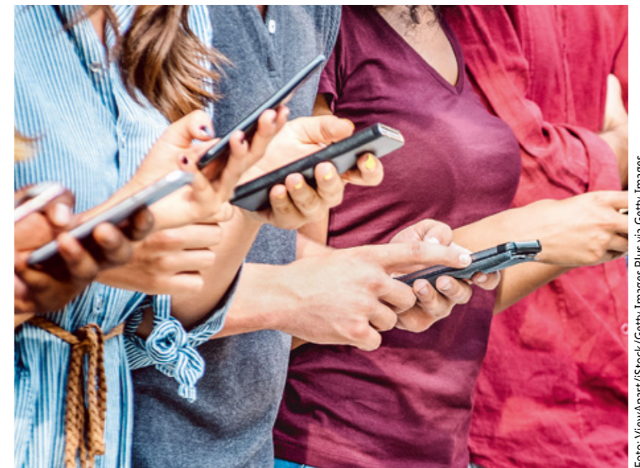
„Digital Natives“ verfügen nicht automatisch über die notwendigen digitalen Kompetenzen, um eigenständig von zu Hause aus zu lernen und zu arbeiten.

Man muss nicht alles können und erst recht nicht sofort. Dazu sollten Ausbilderinnen und Ausbilder ebenso wie Lehrerinnen und Lehrer stehen und ihre Schülerinnen und Schüler um etwas Geduld und Nachsicht bitten, wenn es mal nicht auf Anhieb funktioniert. Wer auch hier im Gespräch bleibt und offen ist für Vorschläge, stärkt letztlich die Beziehung. So kann das gemeinsame Lernen immer besser gelingen – in der Krise und darüber hinaus. ■