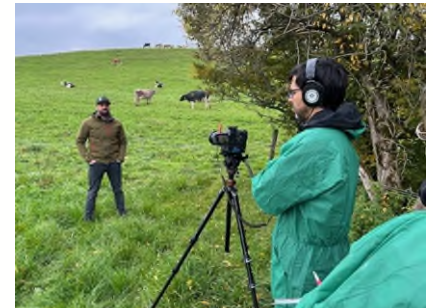
Abb. 2: Hinter den Kulissen eines Fachvideodrehs.

aufgrund eines Beschlusses des Deutschen Bundestages