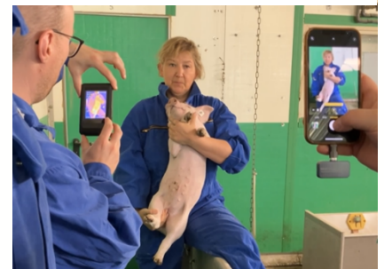
Abb. 3: Praktische Übung zum Einsatz einer Wärmebildkamera.