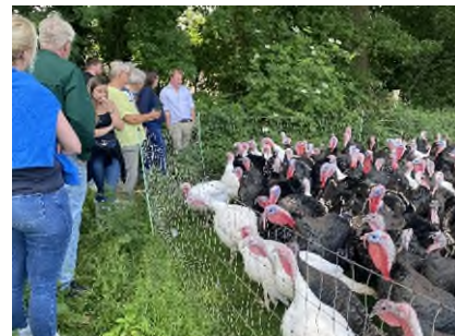
Abb. 1: Besuchergruppe auf einem Impulsbetrieb.

Das Netzwerk Fokus Tierwohl hat sich als etablierte Marke positioniert und bietet bundesweit abgestimmte Antworten auf zentrale Tierwohlfragen. Das breite Angebot umfasst vielfältige Formate der Wissensvermittlung. Ein Beispiel ist der Veranstaltungskalender auf der Projektwebseite, der die zahlreichen Veranstaltungen der Bundesländer aufführt. Diese werden von Tierwohlmultiplikatorinnen und -multiplikatoren der jeweiligen Bundesländer organisiert und decken die Tierarten Rind, Schwein und Geflügel ab, in kleinerem Umfang auch Neuweltkameliden, Pferde und kleine Wiederkäuer. Die Veranstaltungen finden sowohl online als auch in Präsenz statt und sind dank der Förderung durch das Bundesministerium für Landwirtschaft, Ernährung und Heimat kostenfrei.